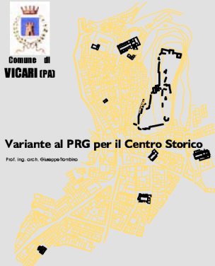
Planimetria di progetto: modalità d'intervento sul patrimonio edilizio esistente e comparti di ristrutturazione 15 Scala 1:1.000

Population: 3.400 Exstention: mq 151.500